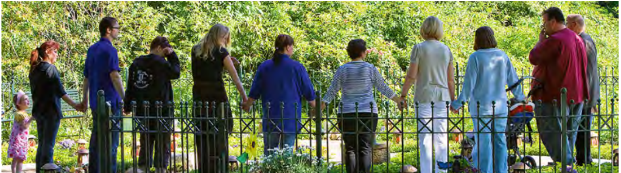
Abschiednehmen in unserem Garten der Erinnerung

Ein kleiner Bronze-Engel wird dem Kind in die Nähe gelegt. Er soll es von nun an beschützen. Mit dem Kind auf dem Arm oder im Kinderwagen gehen wir gemeinsam mit einer unserer Trauerbegleiterinnen in den Garten der Erinnerung. Auch nachts. Andere Eltern, die zur Entlastungspflege bei uns sind, begleiten häufig die betroffenen Eltern. Erleben bewusst den Weg, den auch sie irgendwann gehen müssen. Alle Kerzen in den Lampen unserer Sternkinder im Garten der Erinnerung sind angezündet. Auf einem kleinen Schmetterling aus Sandstein steht eine Lampe, die wir den Eltern reichen. Sie stellen die Lampe