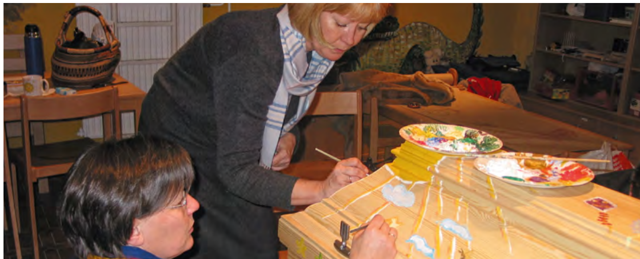
Eine Sargbemalung in der Sternenbrücke

Seite, wird meistens im Kaminzimmer geführt. Alle besonderen Wünsche werden sensibel aufgenommen. Häufig haben sich die Eltern schon lange vorher Gedanken gemacht und mit uns darüber gesprochen. Sie wissen genau um ihre Wünsche, teilen uns aber auch ihre Ängste mit, über die wir dann in Ruhe sprechen. Die Zeit bis zur Beerdigung wird bei uns fast immer mit dem Bemalen des Sarges gefüllt. Der Bestatter bringt ihn sofort, wenn der Wunsch geäußert wird, und stellt ihn in unseren Kreativraum. Die Familie, Freunde, andere Eltern, die mit der Familie bekannt sind, und Mitarbeiter der Sternenbrücke bemalen den Sarg, wenn die Eltern es möchten. Schmetterlinge, Sonne, Tiere, Engel und vieles mehr wird mit viel Liebe gemalt. Ein Vater sagte einmal: „Das ist doch das letzte Zuhause unseres Kindes und ein Zuhause sollte doch schön sein.“ Unter dem Deckel werden Bilder der Familie befestigt. Ein Geschwisterkind möchte eine Taschenlampe hineinlegen. Die Familie