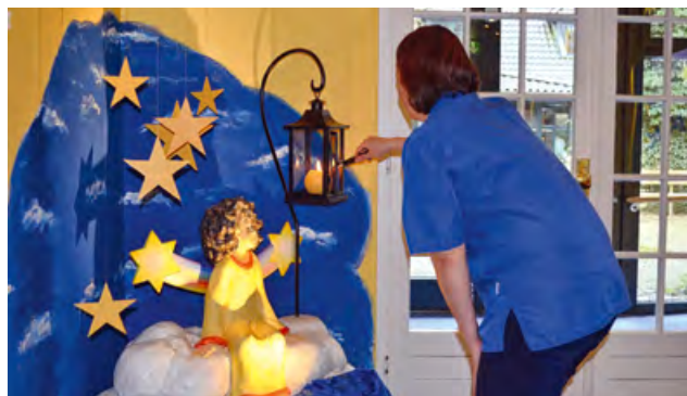
Eine Pflegekraft entzündet eine Kerze am Eingang

Wenn das Kind „über den Regenbogen geht“, öffnen wir, wenn die Eltern es möchten, das Fenster, damit die Seele zum Himmel fliegen kann. Ein Ritual, das sehr weit verbreitet ist. Im Eingangsbereich des Hauses wird eine Kerze angezündet. Ein Zeichen für