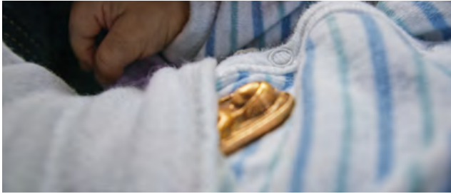
Ein Bronze-Engel begleitet „unsere“ Kinder auf ihrem Weg

jeden, um vorbereitet das Haus zu betreten. Wenn die Eltern es wünschen, lassen wir sie mit ihrem Kind alleine, um Abschied zu nehmen. Natürlich bleiben wir auch bei ihnen, wenn sie es möchten. Je nach Situation benachrichtigen wir Menschen, die den Eltern wichtig sind. Eine Pflegekraft informiert alle anderen Pflegekräfte. Viele kommen dann spontan in unser Haus, um an der Seite der Eltern zu stehen und Abschied von dem Sternkind zu nehmen.