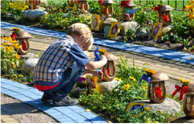
Ein verwaistes Geschwisterkind im Garten der Erinnerung

berührt, befühlt und setzt sich mit diesem „Zuhause“ auseinander. Be-greifen hat etwas mit „anfassen“ und „greifen“ zu tun. Der Sarg beängstigt nicht mehr. Es wird viel über das Kind gesprochen. Zu jeder Figur gibt es eine Erinnerung. Manchmal ein Lächeln zu der Geschichte, manchmal Tränen.